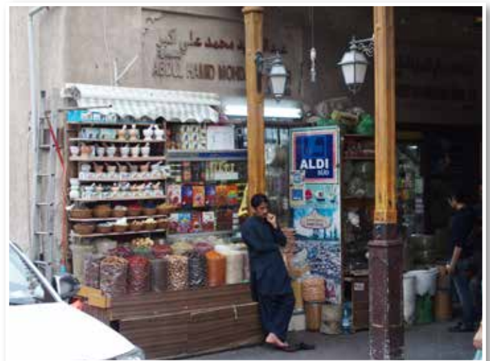
ALDI ist überall