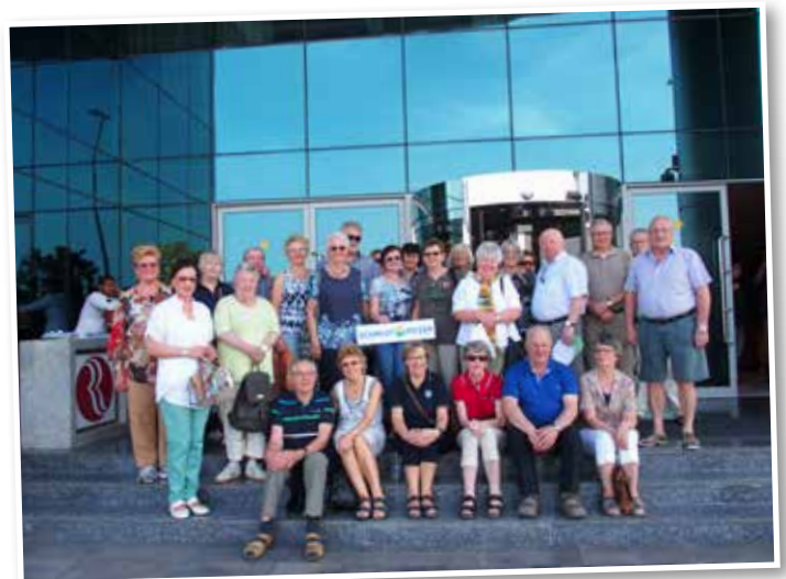
Reisegruppe vor dem Hotel in Dubai