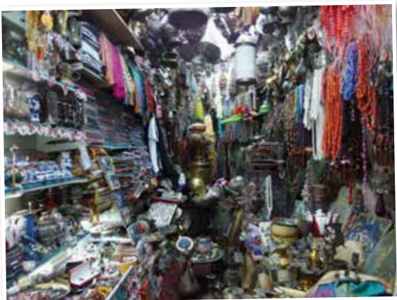
Ladengeschäft im Souk