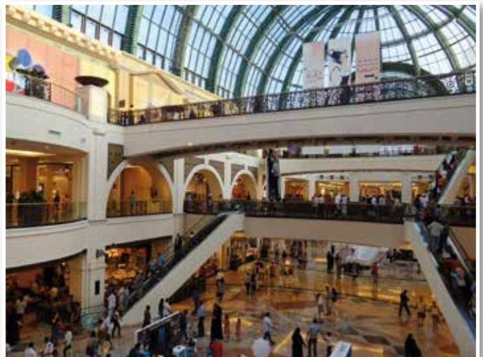
Mall of the Emirates