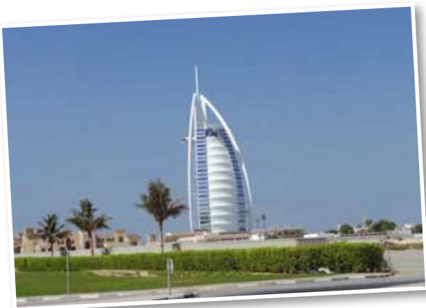
Burj al Arab