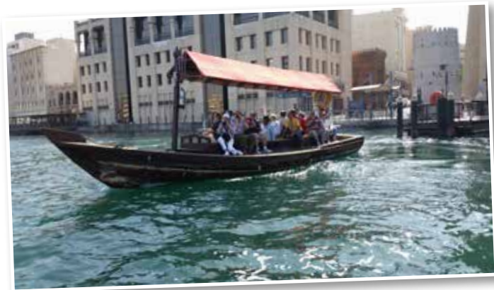
Wassertaxi über den Creek