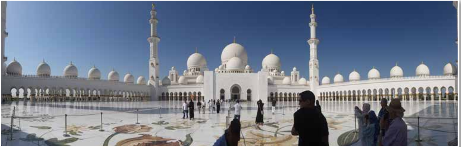
Moschee Abu Dhabi