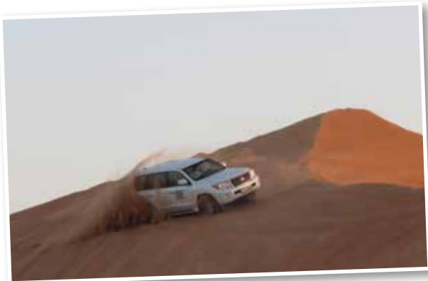
Wüsten-Safari mit dem Allrad-SUV